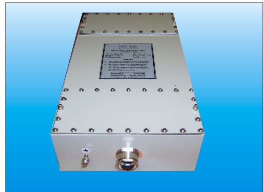
Einfügungs-Dämpfung nach CISPR 17 in 50 \Omega -Systemen, asymmetrisch, mit und ohne Last

Für TEMPEST- und EMP-Anwendungen, sowie bei möglichen Überspannungs-Spitzen, werden die Filter mit Varistoren (V-Serie) ausgestattet.